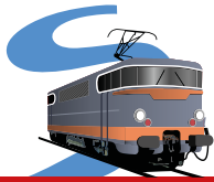
SEINE MODÈLE CLUB FERROVIAIRE

Installée à Morgny la Pommeraye, derrière l'épicerie, depuis bientôt 10 ans, l'association Seine Modèle Club Ferroviaire, créée en 1979, imagine et reproduit des décors ferroviaires aux